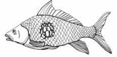
চিত্র- মাছের ক্ষত রোগ