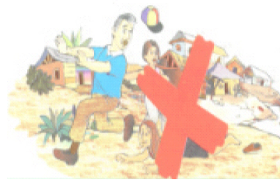
Acciones que pueden aumentar nuestra vulnerabilidad.