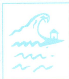
El Tsunami amenaza natural.

Practical Action, The Schumacher Centre for Technology and Development, Bourton on Dunsmore, Rugby, Warwickshire, CV23 9QZ, UK