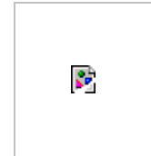
Fig. 2 Un arbre de décision pour les paysans et vulgarisateurs pour la protection du maïs dans les stocks paysans (d'après Farrell et al. , 1996)

milieu naturel à la réduction de leur incidence dans les greniers à maïs ruraux, mais il est possible que les réductions observées dans les populations latentes dans l'environnement entraînent une faible incidence du ravageur dans les greniers. En fait, les données d'essais de stockage en milieu réel en Afrique de l'Ouest montrent une réduction considérable de l'infestation de GCM et une baisse des pertes de maïs avec l'établissement de T. nigrescens . Des lâchers du prédateur de même qu'une analyse d'impact sont prévus pour les principales régions maïsicoles du pays; ces régions plus humides et plus fraîches ne sont que récemment tombées sous l'emprise du GCM.