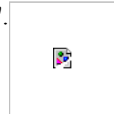
Fig.2. Deviations in the performance of the system from a "social optimum".

In the post-harvest sector, the co-ordination of the different government activities is more important than others, because responsibilities are shared by many Ministries and Departments. As in agricultural production, co-operation between research and extension is primordial. Co-ordination with macro-economic planning and sector-based policy is a