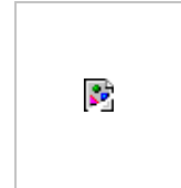
Fig. 1 L'infestation du grand capucin du maïs au Kenya entre 1983 et 1997.

Les restrictions phytosanitaires imposées à la région de Taita-Taveta par annonces, conformément aux dispositions de la loi sur la protection des végétaux (Chap. 324), furent rigoureusement appliquées par la fonction publique. Elles ont permis de restreindre le déplacement du maïs de la région infestée vers l'arrière-pays. Au début, la quarantaine fut efficace, mais la pénurie d'inspecteurs ainsi que le manque de bonne volonté de la