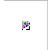
Fig. 1 Gestion intégrée du maïs stocké dans les petites exploitations agricoles.