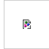
Fig.2. A decision tree for farmers and extensionists for maize protection in farm stores (from Farrell et al. , 1996)