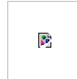
Figure Integrated Stored Maize Management for Small-scale Farms

The changed priorities in GTZ's post-harvest management approach means that activities are no longer focused on technical problems like storage losses but on the people facing post-harvest problems.