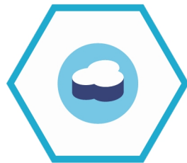
Cloudant NoSQL DB IBM