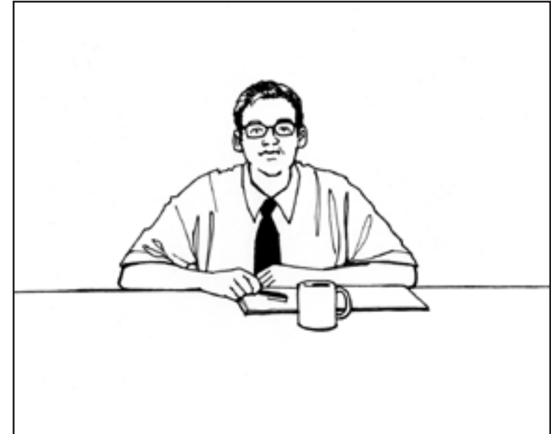
Migrera till en IBM System p miljö!