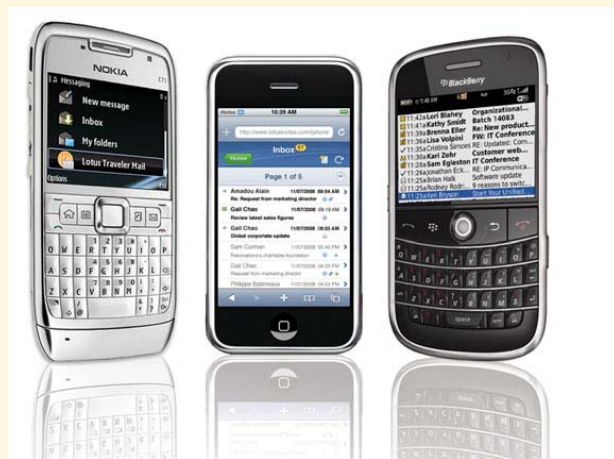
1. ábra. Érze el a Lotus Notes és Domino szoftvereket tetszése szerinti készülékről.