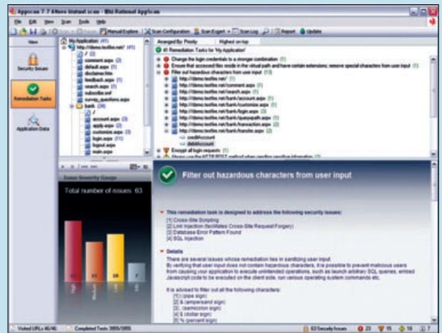
IBM Rational AppScan 개선 보기