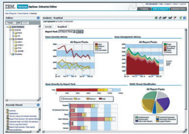
IBM Rational AppScan Enterprise Edition 대시보드 보기