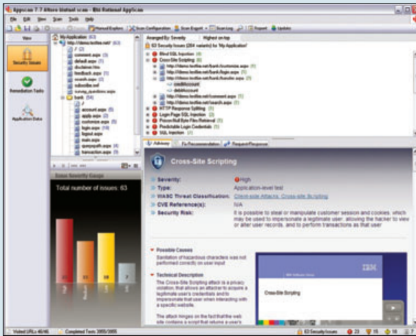
IBM Rational AppScan 보안 지원 보기