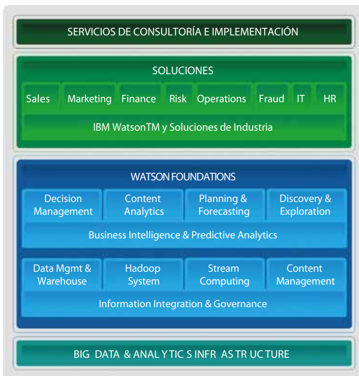
Figura 2. IBM proporciona a las organizaciones los servicios, las soluciones, la plataforma y la infraestructura que necesitan para una implementación viable en el área big data & analytics.