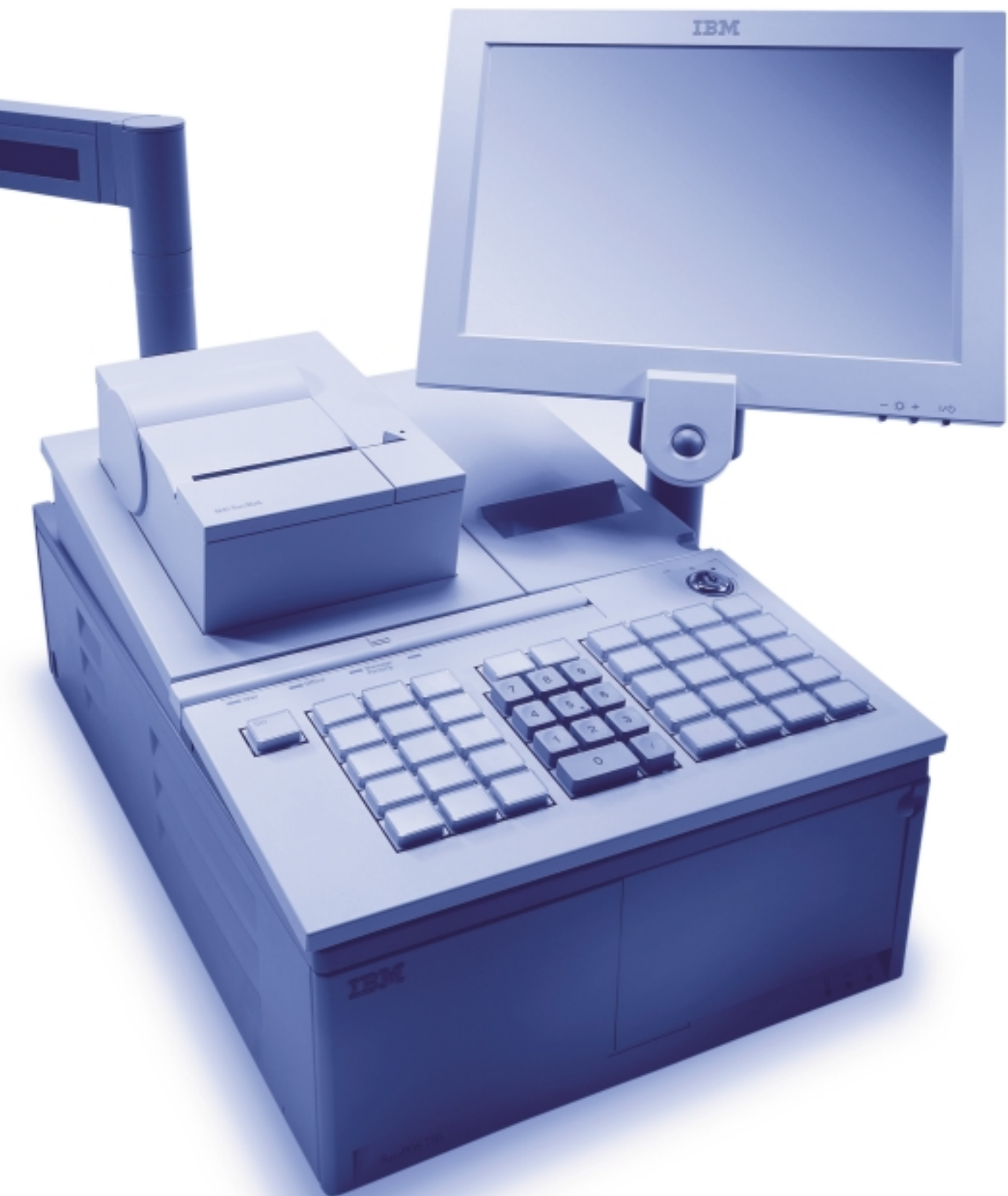
IBM SureMark Printer Model TM6 / TM7 integrated with IBM SurePOS 750