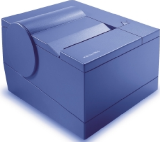
الطابعة IBM SureMark الموديل TF6 / TF7