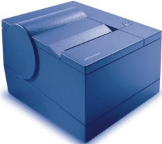
IBM SureMark-printer, model TF6 / TF7