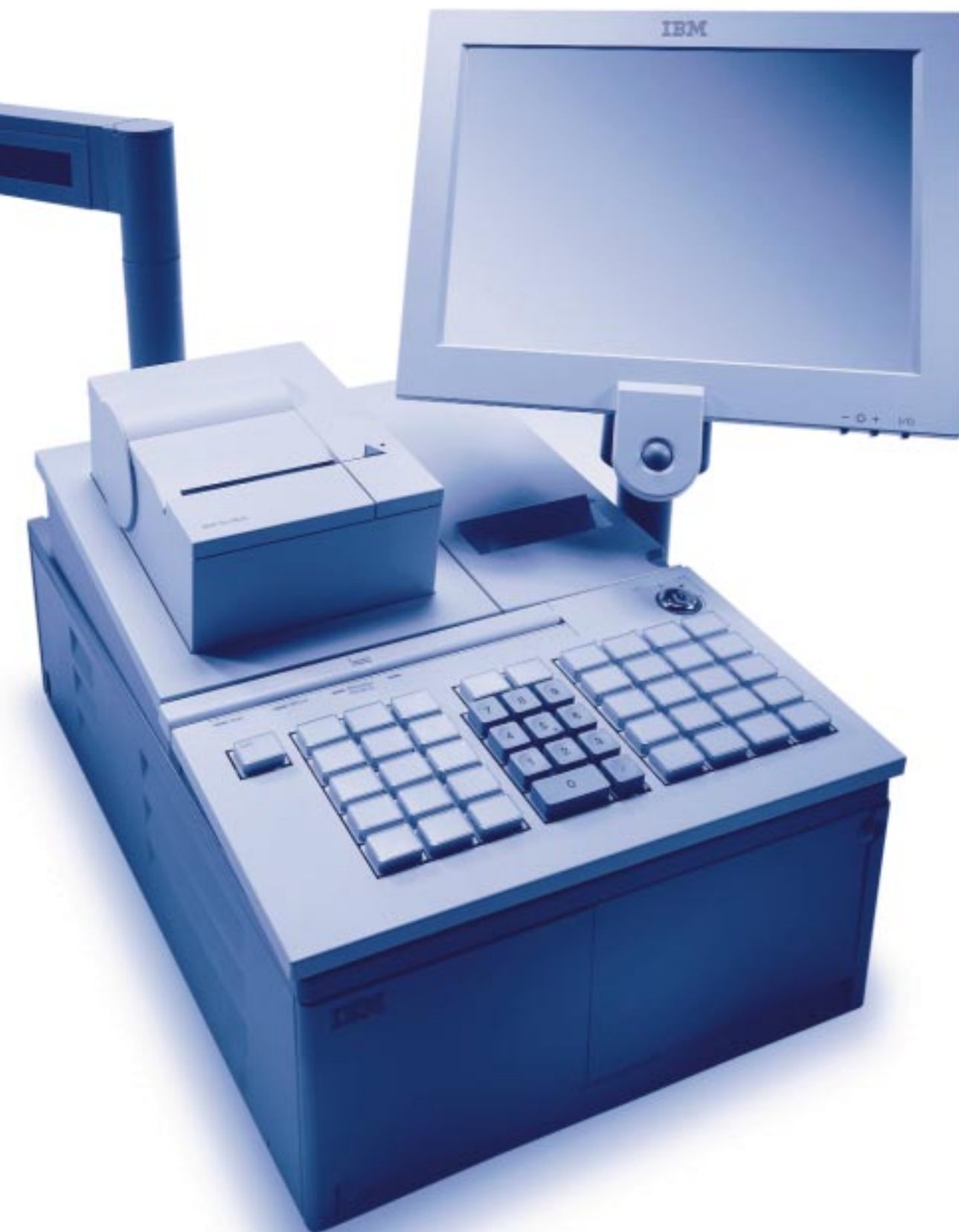
IBM SureMark-printer, model TM6 / TM7 geïntegreerd in IBM SurePOS 750