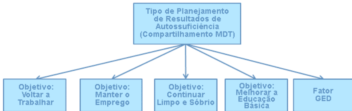
Figura 3. Estrutura de Planejamento de Resultados