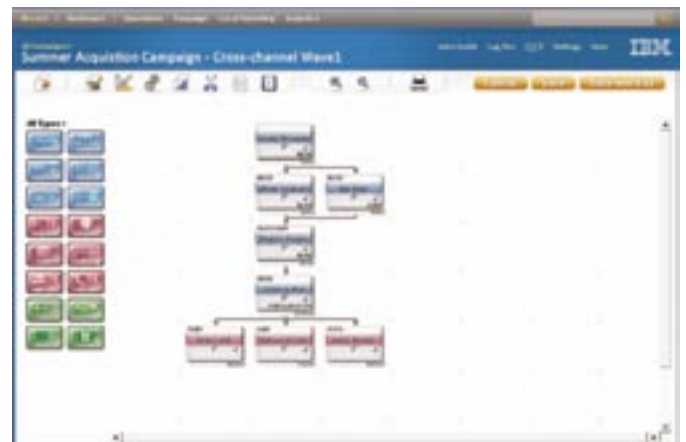
圖1：Unica Campaign 以流程圖型使用者介面將作業功能與彈性最大化，針對最複雜的跨通路行銷活動，賦予行銷人員設計與管理的能力。

IBM Unica Distributed Marketing ：授權地方行銷團隊建立聯絡策略及執行行銷活動